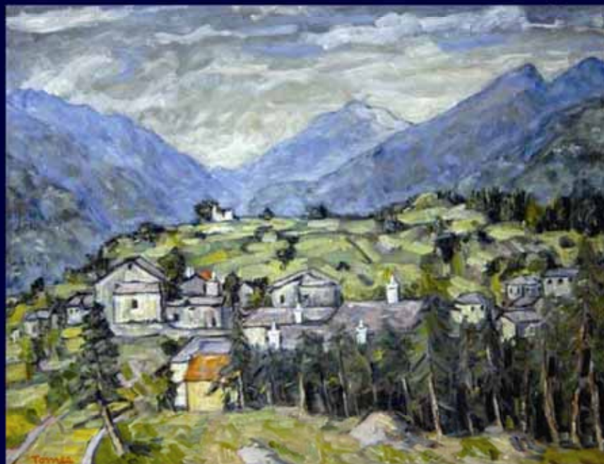
Fiorenzo Tomea - dalla Torre di Teglio (1954)

Sala Conferenze Bormio Terme - Via Stelvio, 10